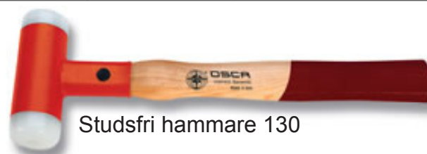
Studsfri hammare 130